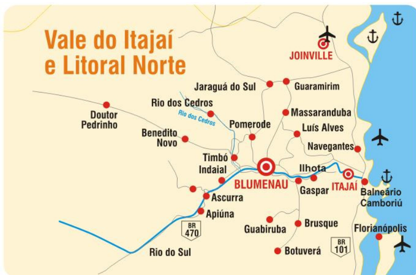
Figura 1 – Mapa de Blumenau e região.

Em se tratando de um estudo cujo pressuposto teórico se assenta no fato de o sujeito constituir sua subjetividade na materialidade, a partir das experiências vivenciadas e da realidade em que está inserido, a compreensão sobre particularidades características da região na qual foi realizada a pesquisa é elemento indispensável. Os psicólogos participantes deste estudo estão inseridos e trabalham em um contexto específico e com características peculiares, as quais sem dúvida influenciam os sentidos que atribuem a sua atuação profissional, bem como as relações entre esses sentidos e suas práticas de trabalho, desenvolvidas cotidianamente em organizações localizadas na região. Com vistas a facilitar a localização do leitor, apresenta-se abaixo o mapa de Blumenau e seu entorno.