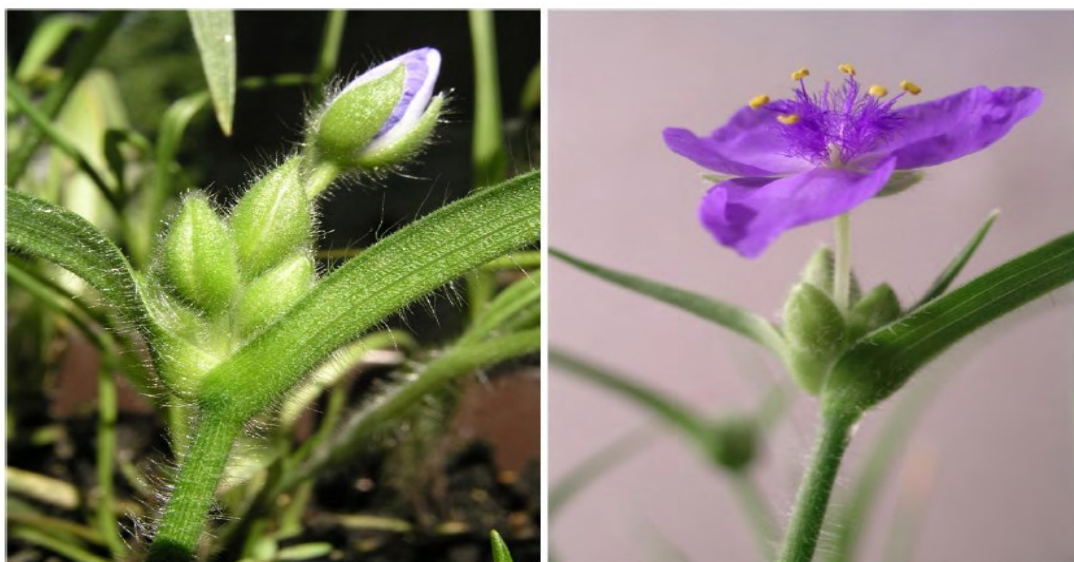
Figura 2: Tradescantia clone BNL 4430, utilizada para o ensaio TRAD-SHM (MAZIVIERO, 2011).

O clone estéril Tradescantia BNL 4430, possui 2n=12 cromossomos (todos metacêntricos), é oriundo do cruzamento entre um híbrido estéril ( Tradescantia hirsutiflora × Tradescantia subcaulis ). Esta esterilidade certifica a homogeneidade genética do clone na ausência de efeitos mutagênicos (WHITE; CLAXTON, 2004 apud MAZIVIERO, 2011) (Figura 2).