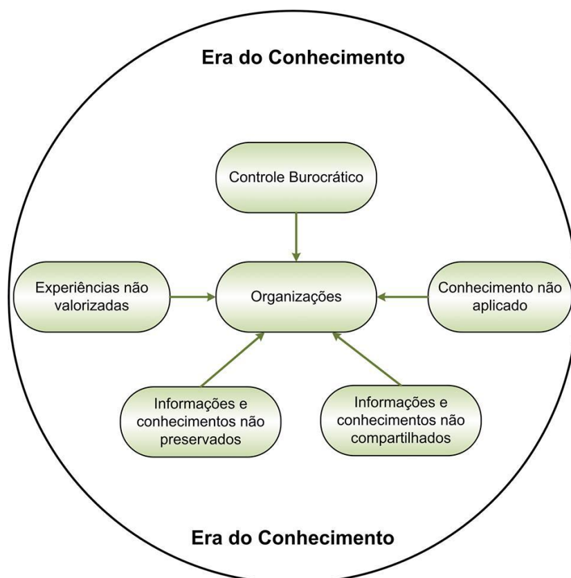
FIGURA 1 – Organizações no Brasil

Primeiramente, o conhecimento foi alvo de interesse das organizações privadas e posteriormente se iniciaram estudos em organizações públicas. No Brasil, entretanto, ainda ocorre de muitas organizações cometerem o erro de não observarem a importância do conhecimento organizacional, conforme aponta a Figura 1. Este fato é ainda mais crítico em algumas organizações públicas que, na maioria das vezes, não percebem a quantidade de informações que são desperdiçadas diariamente dentro do ambiente organizacional público.