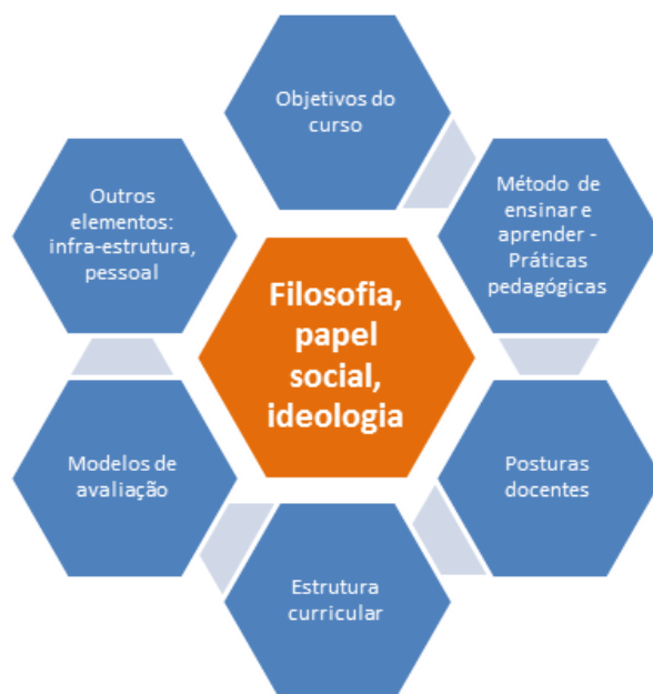
Figura 2 – Estrutura do Modelo de Ensino