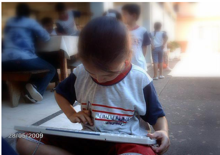
Figura 3 - Criança brincando com teclado velho em uma escola pública

Caso pudéssemos identificar um ponto, um momento dentro da minha trajetória de formação para chamar de pedra fundamental deste percurso do doutorado, diria que este aconteceu quando um aluno que eu orientava em seu trabalho de conclusão de curso (Licenciatura em Educação Física) me mostrou uma fotografia registrada em uma das escolas que fazia parte do seu campo de investigação. Foi com essa imagem 185 que iniciei a escrita, ainda no ano de 2009, do projeto preliminar de pesquisa que seria apresentado no processo seletivo para ingresso no curso de doutorado em Educação da Universidade Federal de Santa Catarina.