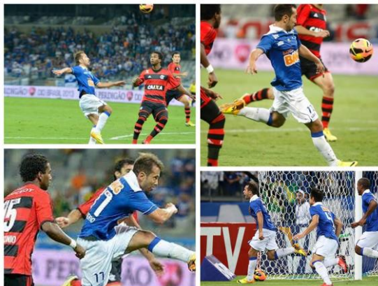
Figura 2 - Colagem: chute a gol no futebol.