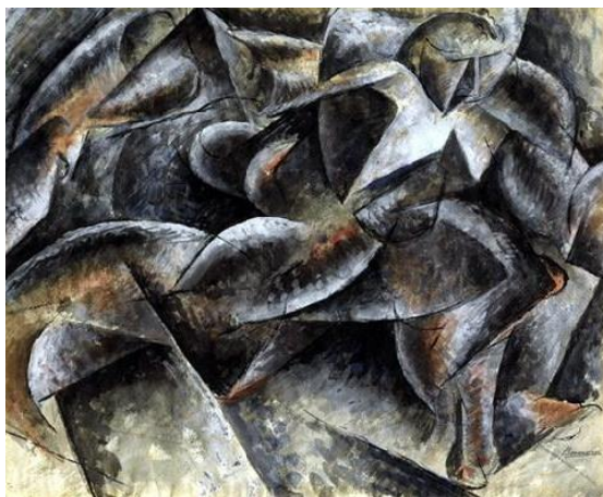
Figura 1 - Estudo de um jogador de futebol (Umberto Boccioni).