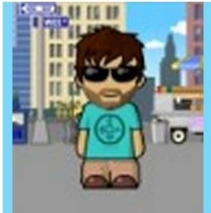
Figura 4 - Avatar utilizado no meu perfil do Skype

Em outra ocasião, o menino, já com seis anos, conversava com um casal de tios que mora no Canadá. As imagens eram compartilhadas pelas câmeras dos computadores aqui e lá. O menino sabia que estava vendo os tios que estavam em outro país. Encantava-se com a neve que lhe mostravam pela janela. Perguntava detalhes sobre como era a vida naquele lugar longínquo, gelado e um tanto diverso. Até que o outro notebook dos tios, no Canadá, também começou a anunciar uma chamada. Era a avó do menino, que do Brasil tentava conversar com o seu filho distante. Neste momento, para o menino, fez-se uma magia, daquelas só possíveis com as grandes descobertas. Os tios colocaram os notebooks frente a frente. O menino via a avó em uma tela, e era visto por ela na outra. A avó então o cumprimentou: “Oi meu menino, nos encontramos no Canadá!”. A descoberta gerou uma euforia incontida, verdadeira festa. Até então, o menino não tinha materializado a noção da sua presença na imagem de uma tela que estava em outro país: “Eu estou no Canadá! A Vó pode me ver no Canadá!”. O menino, que se via na conversa sempre daqui, com o truque dos computadores que se filmavam, sentiu-se representado corporalmente de lá.