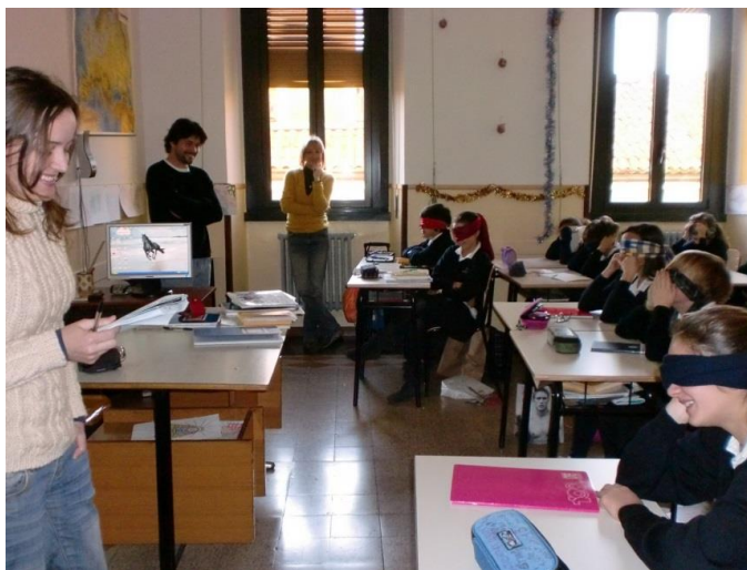
Figura 6 - Crianças vendadas escutam apresentação dos convidados

outro Aquiles). Conversamos com as crianças, contamos que éramos brasileiros. Os meninos me perguntaram sobre futebol e começaram a listar nomes de jogadores. “Mas você não se parece com um jogador de futebol brasileiro!”, disse um dos meninos. “Parece, sim”, disse outro, “ele tem a mesma cor de pele do Kaká”. E logo se voltaram para a Iracema: “Mas ela não parece brasileira, você é russa, não é?”.