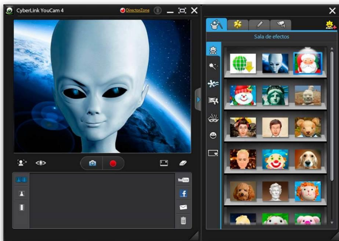
Figura 7 - Interface do programa utilizado para brincar com dublagens

boca, e assim por diante. As crianças ficaram eufóricas revendo as gravações e escutando as próprias vozes nos personagens. Várias delas criaram pequenos enredos e histórias. Um menino escolheu a imagem de um alienígena e repetiu, com voz distorcida, o aviso: “atenção crianças, cuidado, vou comer vocês!”