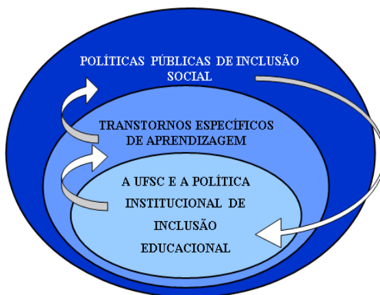
Figura 1 - Caminho teórico proposto para este estudo

Com vistas a atingir os objetivos inicialmente propostos, desenvolvi este estudo, partindo da minha realidade concreta, ou seja, a UFSC e a Política Institucional de Inclusão Educacional por ela desenvolvida, investigando a seguir as concepções de TEA e NEE, bem como as Políticas Públicas de Inclusão Social, voltadas à educação superior para, finalmente, em um sentido contrário, voltar ao ponto de partida, buscando desvelar os significados que esta caminhada possa propiciar. Isto posto, vide Figura 01- Caminho teórico proposto para este estudo.