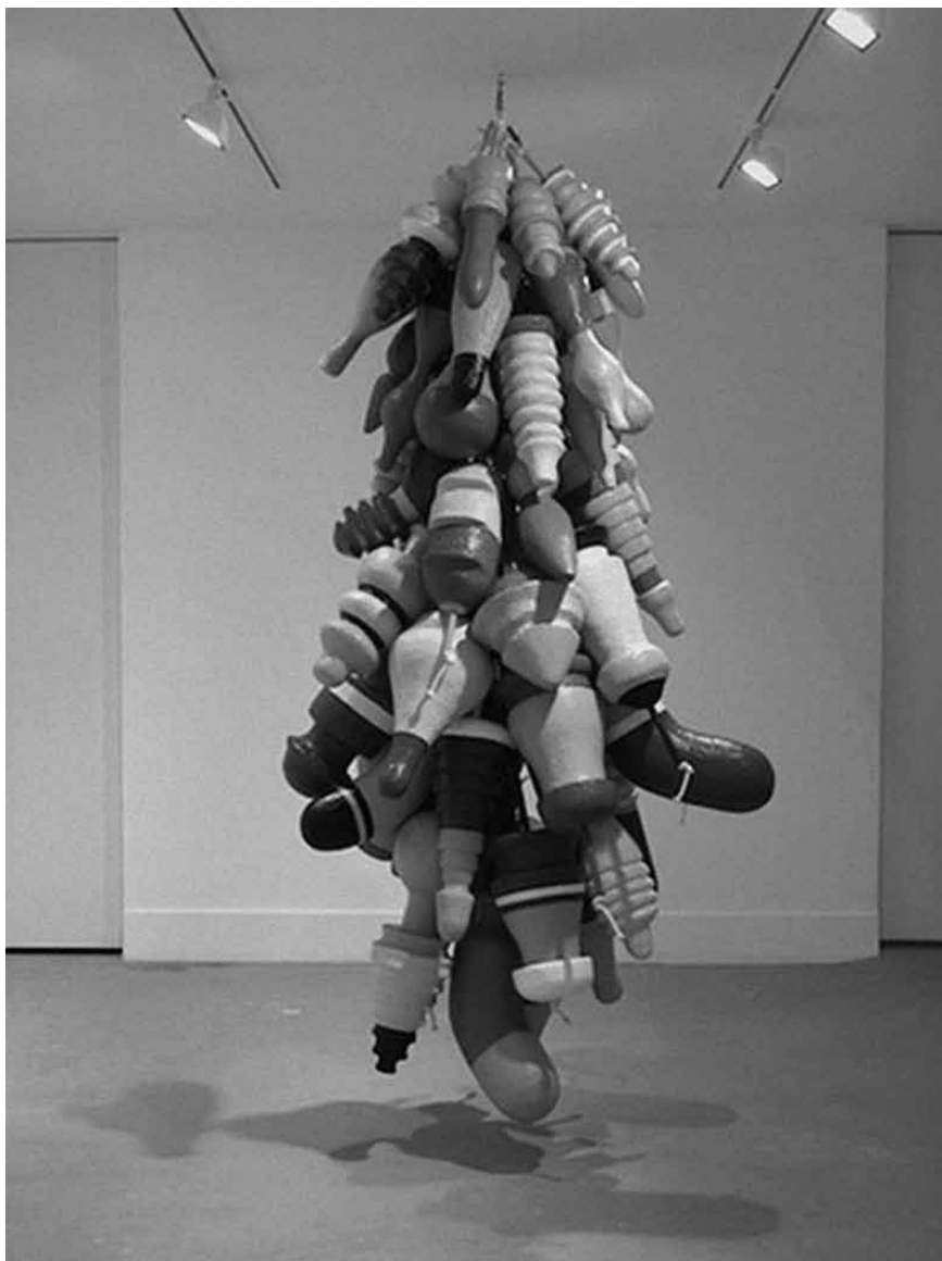
Figura 6 - P-Town — Butt Plugs, 2011. Esferovite, plástico, madeira, esmalte acrílico e corda. Dimensões variáveis. Aproximadamente 3 x 1,2 m.