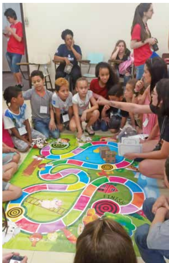
Figura 1 - Jogo da Trilha Agroecológica no Salão de Extensão da UFRGS

Os caminhos para a sensibilização ambiental tiveram início muito antes das atividades em sala de aula. O planejamento e a produção de materiais didáticos constituíram a primeira parte do projeto. Foram elaboradas propostas de acordo com a demanda que a equipe diretiva da EMEF Porto Novo identificou no plano curricular. Foram realizadas reuniões na escola, encontros das professoras coordenadoras do projeto com as bolsistas, e capacitações com os bolsistas de extensão do Programa Horticultura Urbana da UFRGS. A partir dessas discussões iniciais, começaram a ser produzidos os materiais pedagógicos, que incluíram as temáticas da agroecologia com a “trilha agroecológica” (Figura 1) e das plantas