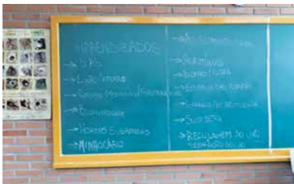
Figura 7 - Levantamento pelos alunos dos temas discutidos durante os encontros