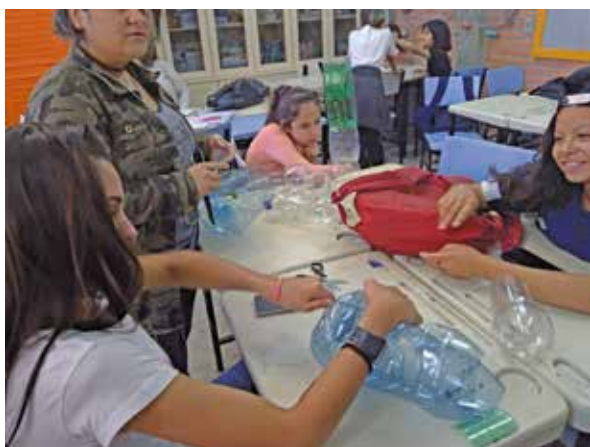
Figura 4 - Montagem dos vasos da horta com os alunos

Posteriormente à semana do trabalho avaliativo, foi colocado em prática o projeto de Hortas Suspensas. Foram expostos para os alunos modelos de suporte para a horta, feitos com garrafas PET reutilizadas, e quais as mudas disponíveis para o plantio (alecrim, hortelã, manjerição roxo e poejo). Foi exigido um pequeno projeto para cada aluno, deixando livre a escolha do modelo e da planta aromática. Os estudantes atuaram apenas nas partes de corte (Figura 4) e de melhor combinação de mudas de acordo com o funcionamento de uma horta suspensa. A turma se mostrou bem empenhada e interessada na parte prática.