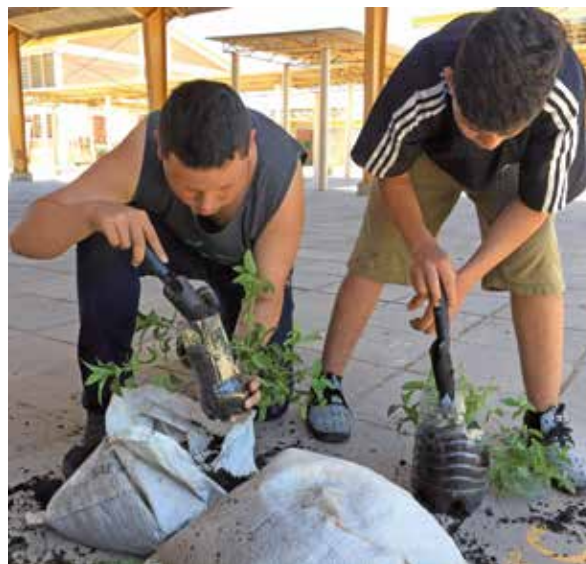
Figura 5 - Alunos plantando as mudas com a utilização do substrato fornecido

O penúltimo encontro foi o dia de plantar (Figura 5 e 6). Foram levadas as mudas adquiridas na Universidade e disponibilizadas para a horta, assim como a terra necessária para a transplantação. Os equipamentos, tais como pás e regadores, a escola já possuía. Cada aluno foi auxiliado na utilização do substrato e no posicionamento do seu vaso dentro do pátio escolar, levando em consideração incidência de luz solar e distanciamento de possíveis áreas de risco. Posteriormente, os estudantes foram encaminhados para a sala de Informática, onde produziram uma ficha técnica de acordo com a(s) muda(s) plantada(s), com seus benefícios e suas adversidades. Além disso, foram exercitadas as habilidades no computador para a criação de um documento formal.