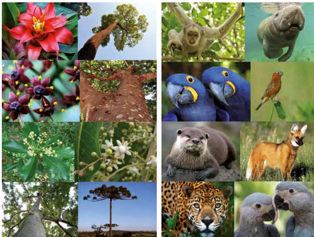
Figura 2 - Cards com as espécies da fauna e flora brasileira em risco de extinção

a possibilidade de acesso ao ensino superior, as oportunidades dentro da universidade e o vasto número de cursos de graduação disponíveis. Posteriormente, foi introduzida a temática da biodiversidade com a utilização de cards (Figura 2) com imagens da fauna e flora ameaçadas de extinção, gerando um debate sobre a falta de cuidados com o meio ambiente. Nesse dia, também fizemos uma roda de conversa sobre agrotóxicos, o seu impacto no ambiente e os benefícios da agroecologia, sempre respeitando os conhecimentos prévios de cada um e buscando instigar a curiosidade do grupo. Para exercitar os saberes em discussão, a turma foi dividida em dois grandes grupos, os quais foram encaminhados para jogos diferentes: o Jogo da Biodiversidade, já mencionado, e a “Trilha Agroecológica”, que levanta questionamentos acerca do uso dos agrotóxicos.