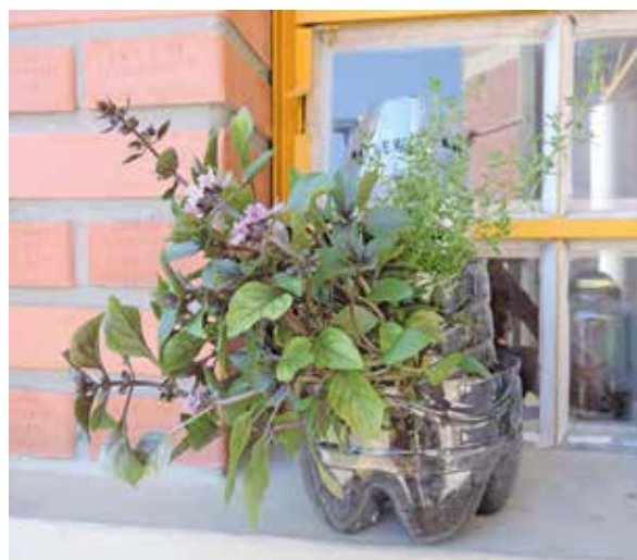
Figura 6 - Vaso pronto confeccionado por um dos alunos

No dia 17/12/2018 houve o encerramento dos encontros, onde foi provocada uma retomada das temáticas discutidas (Figura 7). O resultado foi satisfatório, visto que os conhecimentos foram retomados e em sua totalidade foram mencionados pelos estudantes. Para um fechamento informal e descontraído, as bolsistas planejaram um lanche coletivo que foi seguido de brincadeira em grupo, de perguntas e respostas, para uma recapitulação dos temas abordados. Foi satisfatório ver o resultado do trabalho aplicado e dos laços criados.