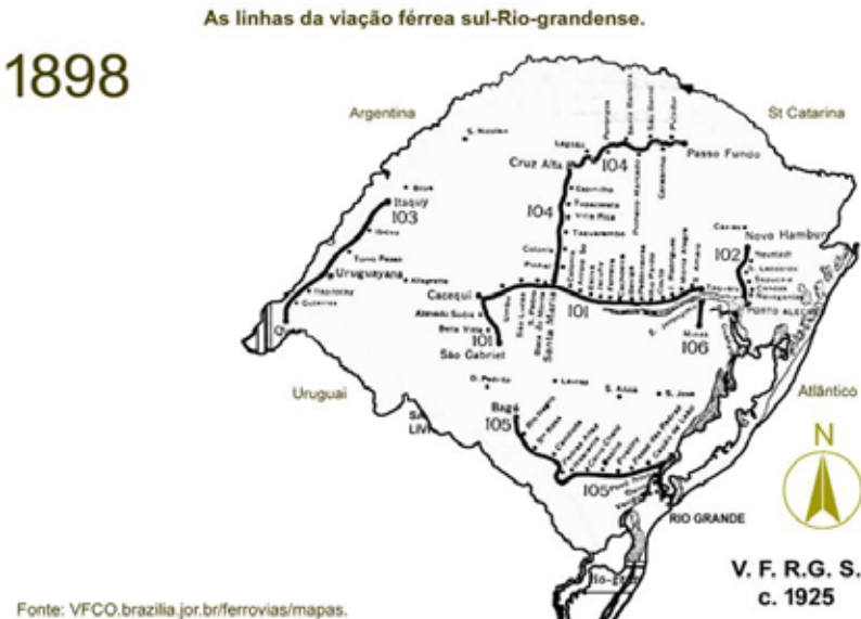
Mapa 1: Malha férrea do Rio Grande do Sul m 1898.

A rede ferroviária gaúcha, por exemplo, serviu como fundamental ferramenta para este fim, sendo que, desde o início do movimento migratório sírio-libanês, esses imigrantes acompanharam o crescimento da rede ferroviária, utilizando-a para espalhar seus representantes nos diversos municípios, mas também transportar mercadorias. Isso explica como, eventualmente, é possível encontrar uma família síria isolada, com vendinha ou armazém em pequeno rincão, sobretudo nas décadas iniciais do início de século XX. Observamos, contudo, que as áreas no norte e no-roeste do estado, especialmente próximo ao Rio Uruguai, entre Erechim, Frederico Westphalen, Palmares das Missões até Santa Rosa, mais a oeste, são as regiões que nos mostram menor número de famílias sírio-libanesas instaladas, o que talvez se explique pelo fato dessas últimas áreas de terras devolutas do estado terem sido colonizadas tardiamente e também mais rigorosamente controladas por seus administradores, como foi o caso de Erechim, por exemplo, que iniciou sua exploração seguindo cartilhas positivistas, orientados pela realidade da época, o que pode ter afastado esses sírios.