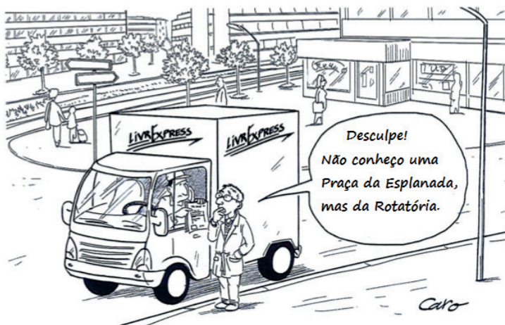
Figura 1: A Rotatória da Esplanada?

Em razão dos inúmeros problemas gerados por uma mudança de nome, as cidades são, então, bastante cautelosas e com frequência se contentam em rebatizar porções de ruas... sem habitantes! Assim, em Estrasburgo, quando o Quai Pasteur foi rebatizado Quai Menachem Tafel, em 2011, não havia praticamente nenhum imóvel comunicando com esse cais: sem endereço, sem problema!