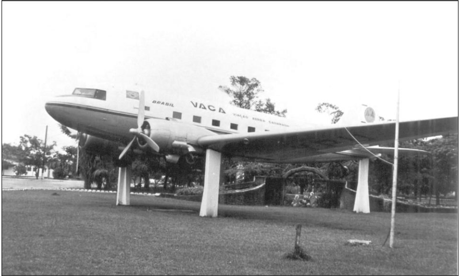
Figura 2: Avião monumento na praça central de Canarana/MT