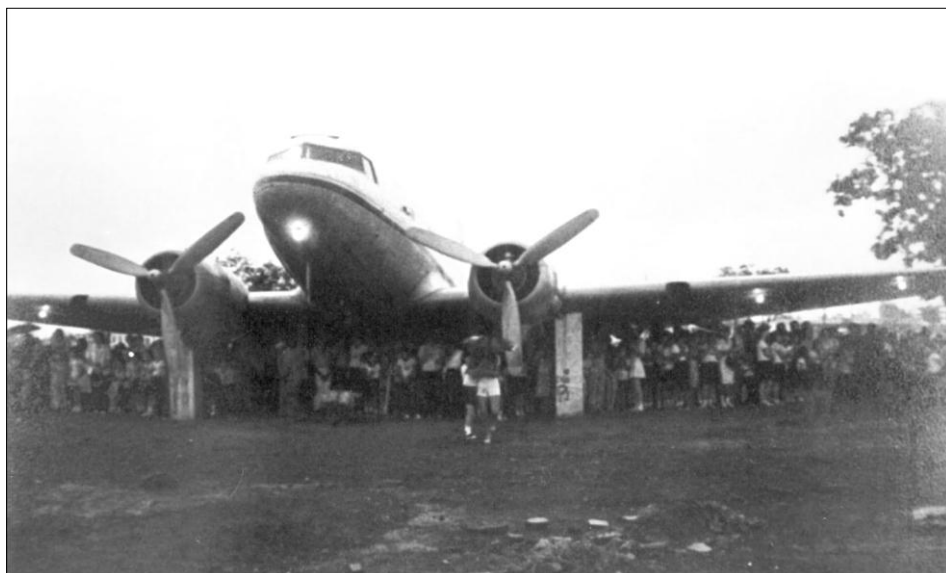
Figura 1: Primeiras famílias de colonos na futura praça de Canarana/MT

As figuras 1 e 2 ilustram dois momentos do município de Canarana/MT. A história desse município vincula-se diretamente ao uso da aviação no transporte de colonos, oriundos principalmente do interior do Rio Grande do Sul para o interior de Mato Grosso. A Coopercana (Cooperativa Agropecuária Mista Canarana Ltda.) foi a responsável pelo transporte de cerca de 300 famílias gaúchas, no início da década de 1970, em seu avião modelo DC3. Terminado o processo de transporte dessas famílias o avião transformou-se em monumento no local onde seria erguida a praça central da então vila (figura 1).