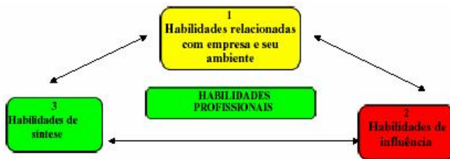
Fig. 1 Pólos de configuração das habilidades profissionais do ator de IC (adaptado de Martinet & Marti, 1995, p. 193)

Martinet & Marti (1995) sintetizam todas essas mesmas atividades, de forma clara e objetiva, através de três pólos complementares, reunindo habilidades e papéis que revelam o foco da ação do ator de IC, conforme demonstra a figura a seguir: