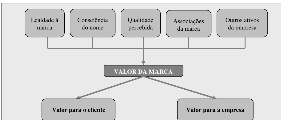
Figura 1 – Modelo de Aaker de “valor da marca”

Para Aaker (1996a), o valor da marca consiste de cinco dimensões relativas à percepção do consumidor: lealdade à marca, consciência do nome, qualidade percebida, associações da marca e outros ativos da empresa, conforme aponta a Figura 1. Ressalta-se que, para esse autor, o valor da marca impacta tanto o valor para o cliente quanto o valor da empresa.