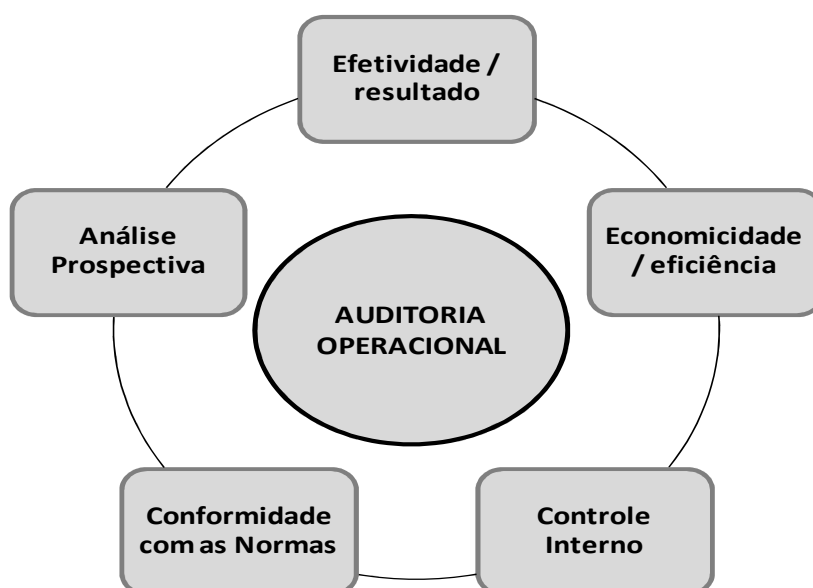
Figura 1: Objetivos da auditoria operacional. Fonte: elaborado pelos autores a partir de conceitos in: GAO (2005).

Segundo o United States Government Accountability Office – GAO (2005) , este tipo de auditoria pode ter geralmente cinco objetivos: efetividade/resultado, economicidade/eficiência, controle interno, conformidade com as normas e análise prospectiva. A Figura 1, apresentada a seguir, oferece uma compreensão coletiva destes objetivos.