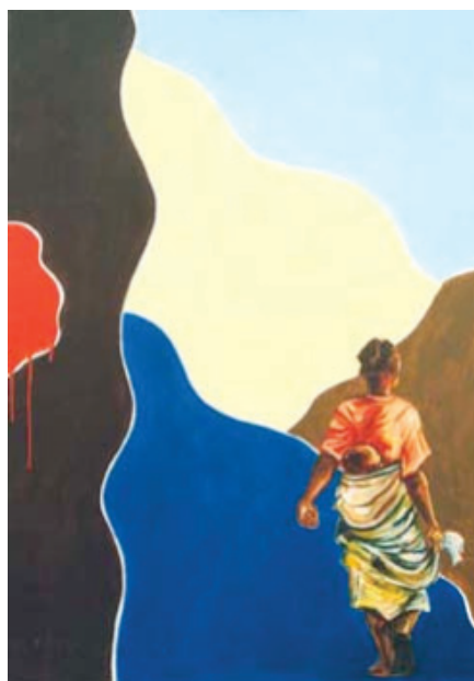
Tela 2: Etona Sem título. Técnica: óleo sobre tela Sem data