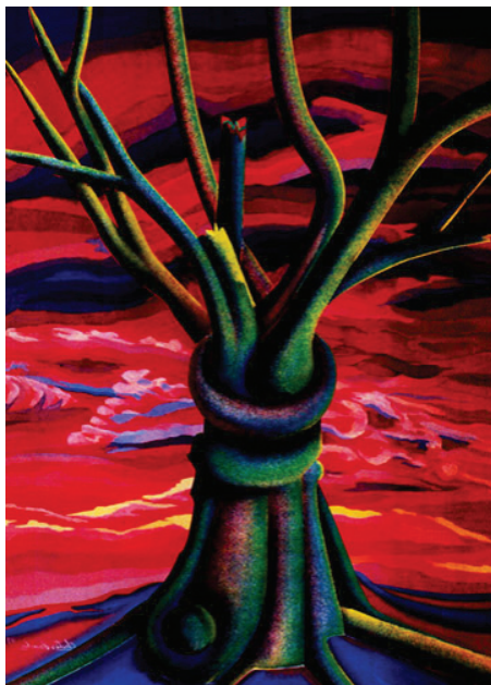
Tela 1: Eleutério Sanches “Alquimia da árvore” (motivação Imbondeiro) Técnica: óleo têmpera sem tela – Ano: 1991