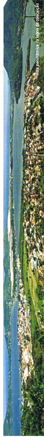
Uma panorâmica da lagoa da concórdia