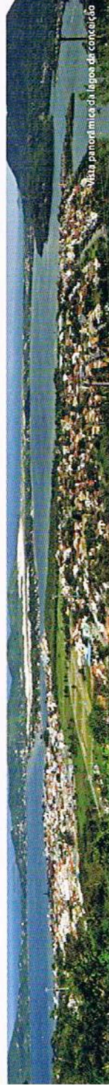
Visão panorâmica da lagoa da conceição