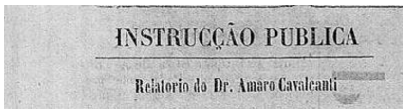
Figura 1 – Cabeçalho do Relatório do Dr. Amaro Cavalcanti.