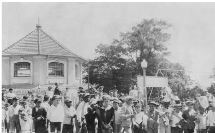
Figura 1 - Praça Alto da Bronze, 1929.

Fonte: Centro de Memória do Esporte, UFRGS. 9