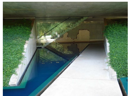
Fig. 1 - Vista do espelho d'água com Panacea Phantastica ao fundo. em Inhotim.