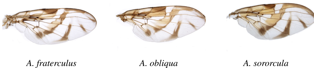
Figura 2. Exemplos de asas das espécies estudadas [Faria et al. 2014].