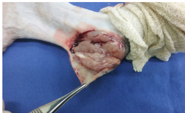
Figura 2. Membro pélvico esquerdo de paciente com esporotricose óssea demonstrando aspecto macroscópico do nódulo em região calcânea ao corte durante a biópsia incisional.