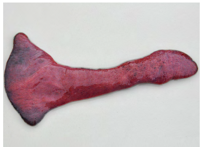
Figura 1. Leishmaniose visceral autóctone em um canino. Baço aumentado e com áreas multifocais arredondadas vermelho-escuras (hemorragia).