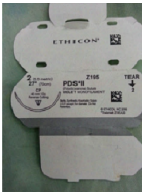
Figura 3. Fio monofilamentar absorvível de Polidioxanona número 2.