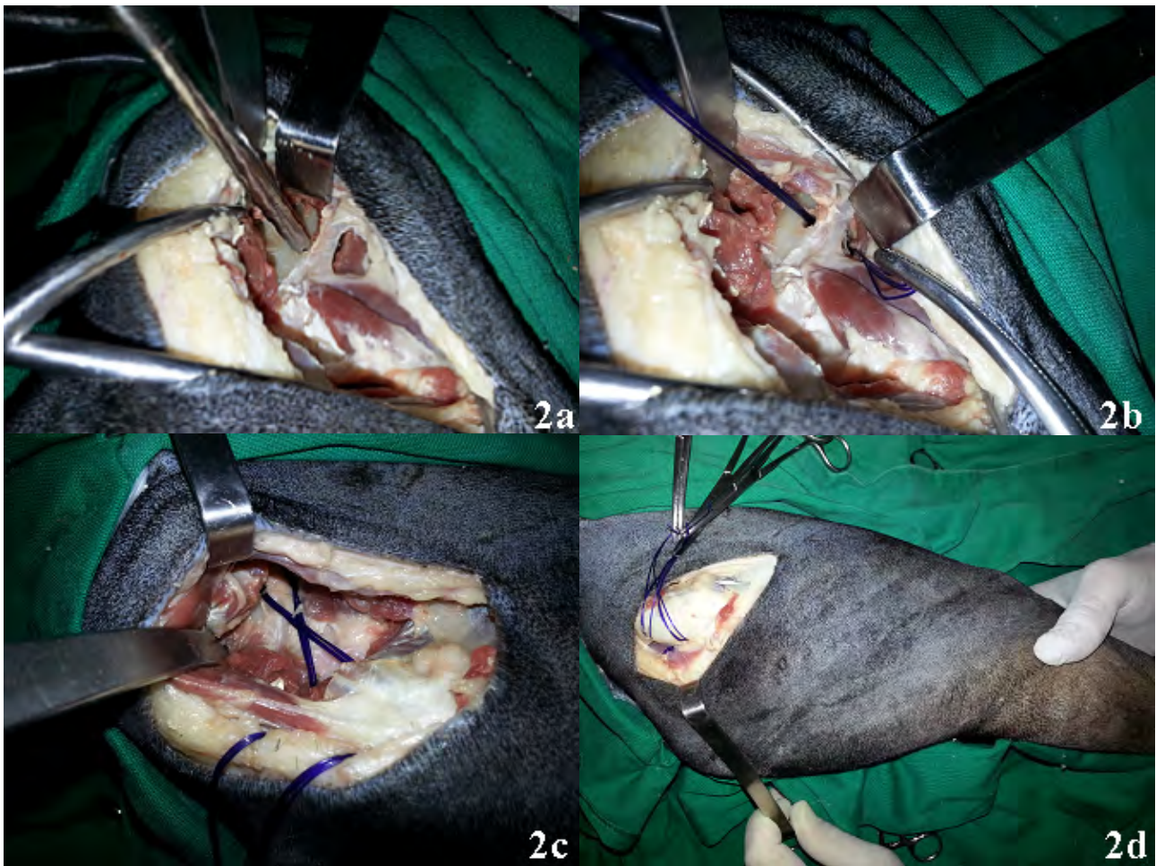
Figura 2. Túnel ósseo realizado no corpo do ílio, com o auxílio de uma perfuratriz elétrica e guia de perfuração 3,0 mm (a). Fios de Polidioxanona passados pelo túnel confeccionado no corpo do ílio e tracionados com o auxílio de uma pinça hemostática curva (b). Fios passados por túnel ósseo confeccionado no trocânter maior e sob os músculos glúteos, configurando um padrão em “8” (c). Com o membro aduzido e ligeira rotação interna da cabeça femoral, fecham-se os nós separadamente na porção caudal do trocânter maior (d). As imagens apresentadas acima são de caráter ilustrativo e não se referem ao paciente do presente relato.