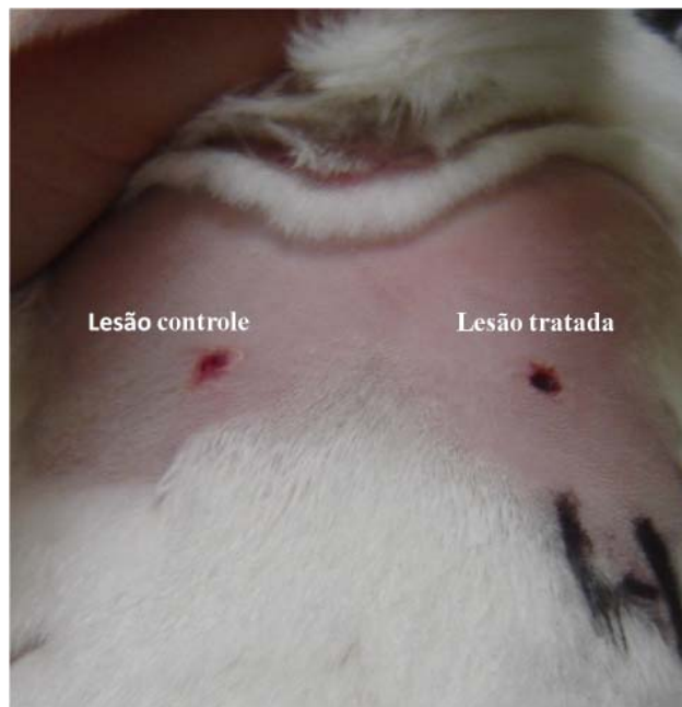
Figura 3. Lesão tratada apresentando crosta escurecida em comparação com a controle que se apresentava avermelhada.

estão demonstradas na Figura 4. Como pode ser notada, a taxa de cicatrização aumentou progressivamente, porém não foram observadas diferenças significativas entre as lesões de controle e as tratadas.