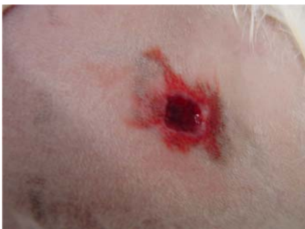
Figura 2. Pequeno sangramento observado na lesão tratada logo após a estimulação com o laser ALGalnP.

encontra descrita na Tabela 1. Foram atribuídos índices histológicos para os achados: ausente, igual a zero; discreto, igual a um; moderado, igual a dois; intenso, igual a três.