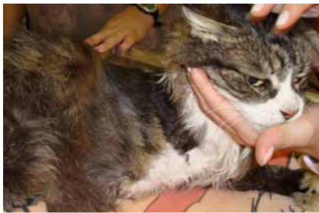
Figura 2. Aparência do felino, fêmea, SRD de 16 anos de idade submetido à amputação do membro anterior direito após o crescimento dos pelos.

A FA aumentada sugere uma lesão hepática ou, ainda, pode ser correlacionada a um pior prognóstico quanto à sobrevivência do animal [5]. Estudos têm mostrado que essa enzima reflete a extensão da neoplasia no momento do diagnóstico, pois está relacionada à atividade celular e, quanto maior a disseminação das células neoplásicas, maior o nível sérico da mesma [2]. Considerando o aumento dos níveis de FA e o aumento bilateral de linfonodos submandibulares e subescapulares como fatores prognósticos negativos, visto que demais valores indicativos de função hepática