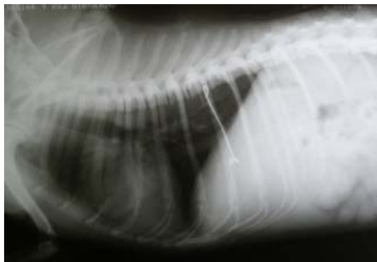
Figura 3. Exame radiográfico no pós-operatório imediato de osteossíntese da sexta e sétima costela em um cão. Notar a presença do implante no canal medular da sétima costela e a linha de fratura (seta).

A avaliação radiográfica pré-cirúrgica não foi realizada, pois os animais dispnéicos descompensam muito facilmente, e não devem ser submetidos ao