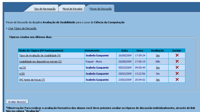
Figura 3: Fórum de discussão – tópicos criados.

A figura 3 apresenta o fórum de discussão, com os tópicos criados e seus respectivos autores. Ao clicar em cada tópico, todas as mensagens referentes a aquele tópico em questão são visualizadas, bem como seus respectivos autores.