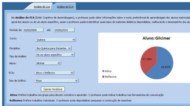
Figura 4: Visualização do ECA de um aluno em uma disciplina.

Como teste funcional da ferramenta, realizamos um teste piloto com dados de 26 alunos aleatórios. Para o Fórum, fizemos uma simulação sobre a quantidade de mensagens postadas, tópicos criados e os cliques nos tópicos do fórum de Discussão. Para o Mural, usamos valores aleatórios para determinar os cliques na aba do Mural de Recados e a quantidade de mensagens postadas. A partir disto, foram atualizados os dados de todos os 26 alunos, para testar o funcionamento do sistema de captura do ECA da dimensão Ativo x Reflexivo. Após este teste piloto, verificamos que a ferramenta comportou-se como o esperado, atribuindo o ECA nas ferramentas de comunicação e o ECA final de uma disciplina para cada aluno.