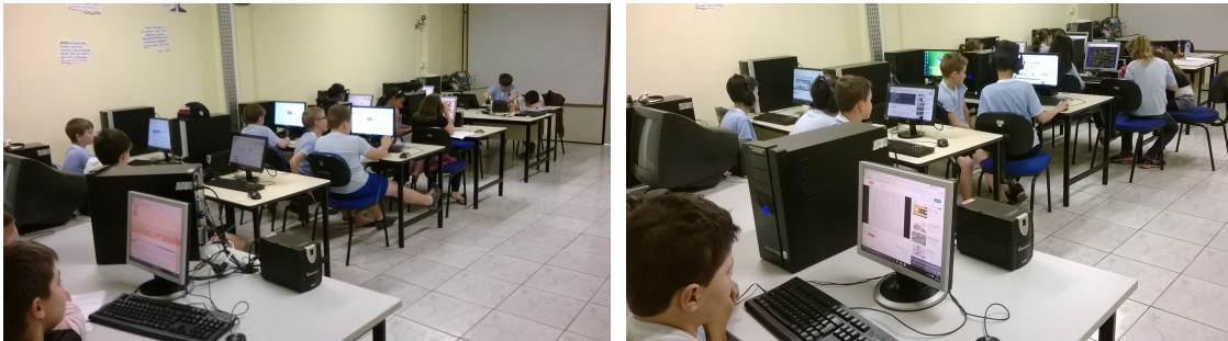
Figura 1 – Registro da primeira etapa do experimento

O primeiro encontro (Figura 1) teve sua atividade vinculada ao conhecimento das funcionalidades do ambiente. Para incentivar os estudantes a realizarem a tarefa, o professor explicou as funcionalidades da ferramenta, ressaltando que, através dela, eles poderiam construir seus próprios jogos. Os estudantes ficaram empolgados e começaram a explorar e conhecer a ferramenta Scratch. Nesta atividade, o professor despertou a disposição para o aprendizado, um dos requisitos necessários para que o estudante realize uma aprendizagem significativa.