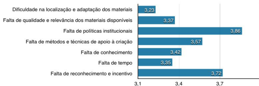
Gráfico 2: Escore médio dos itens avaliados

Ressalta-se que quanto maior for o resultado de EM (ou seja, quanto mais próximo de 4), maior será o nível de importância do item de acordo com a opinião dos participantes. Nesse sentido, o EM para o item “ falta de reconhecimento e incentivo ” foi de 3,72 , estando bem próximo do valor 4. Os EMs para os demais itens avaliados foram calculados seguindo-se os mesmos critérios.