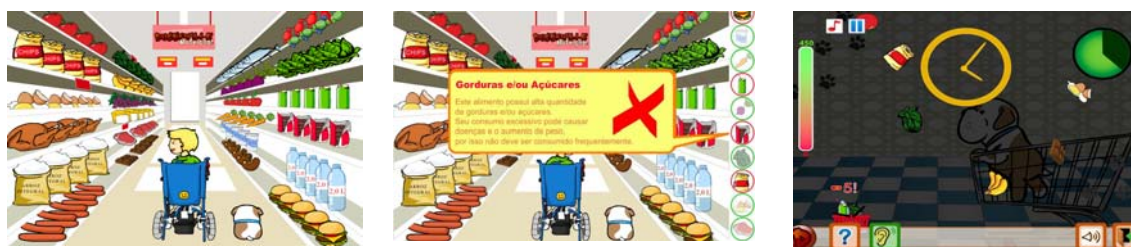
Figura 1 - a) Compras; b) Descrição dos nutrientes; c) Coleta Saudável

O Jogo possui dois desafios: Compras (Figura 1a) e Coleta Saudável (Figura 1b). O primeiro é caracterizado por Tarouco et al (2004) como um jogo lógico, pois estimula mais o raciocínio do que os reflexos. Nesse desafio, o jogador não tem limite de tempo e pode navegar pelo cenário em busca da solução para o problema. O segundo é caracterizado, também por Tarouco et al (2004), como jogo de ação, pois auxilia no desenvolvimento psicomotor, estimulando os reflexos e a coordenação motora. Nesse tipo de jogo, o jogador deve reagir com atenção, reforçando “repetindo” o conteúdo abordado no primeiro jogo.