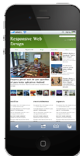
Figura 1 – Layout feito sem uso de técnica

Nas telas menores, a característica slider do menu horizontal é indicada por setas; e o rodapé é reduzido para mostrar apenas as informações julgadas relevantes àquele ambiente – aqui é aplicado o conceito da priorização do conteúdo. As imagens se adaptam ao espaço disponível, bem como o texto e o tamanho da fonte, facilitando a leitura.