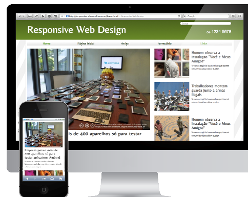
Figura 2 - Design responsivo em diferentes dispositivos