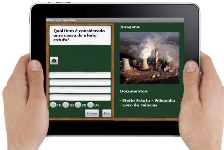
Figura 3: Sistema Rec Quiz empregado na elaboração de pergunta sobre o Efeito Estufa

No que diz respeito à técnica para recomendação escolhida para a aplicação, optou-se pela filtragem de conteúdo pela natureza deste tipo de recomendação. Nesta abordagem, o foco da recomendação está na filtragem de materiais que atendam determinados critérios relacionados ao conteúdo de interesse do usuário. Esta era exatamente a necessidade do sistema aqui proposto. Já a filtragem colaborativa tem como foco identificar interesses comuns em grupos de usuários - o que também poderia ser interessante, mas não essencial no desenvolvimento do Rec Quiz . Já a filtragem híbrida, a qual agrupa características de ambas, poderia ser uma opção também adequada. Contudo, para que realmente pudesse fazer sentido, seria necessário um grupo bastante grande de usuários - o que na prática não ocorre quando imagina-se o sistema sendo empregado no contexto de uma sala de aula. Neste universo, o simples registro da "popularidade" dos itens consultados pelos alunos poderia dar subsídios suficientes para o refinamento das recomendações do sistema.