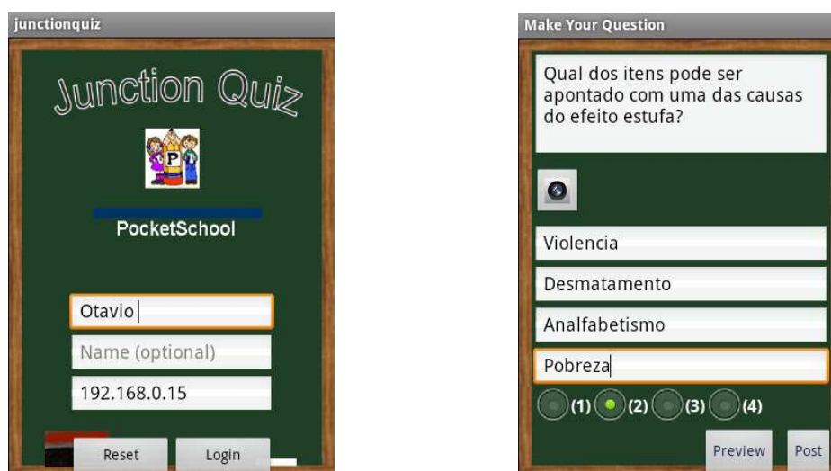
Figura 1: Tela de abertura da ferramenta Junction Quiz e tela de elaboração de perguntas

A Figura 1 apresenta duas telas da ferramenta Junction Quiz , que permite aos alunos compartilhar com seus colegas as questões. A ferramenta também permite a inserção de imagens que possam auxiliar a compreensão das questões e respostas desenvolvidas.