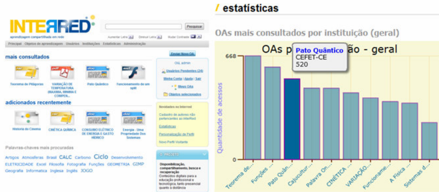
Figura 6 – OA mais consultado no InterRed

Na tela principal de abertura do InterRed (Figura 6) a contribuição da Instituição citada já garante um dos mais acessados OAs, o Pato Quântico, que consiste em uma atividade sobre o efeito fotoelétrico.