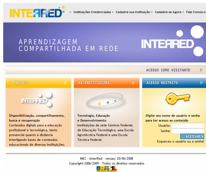
Figura 1 - Tela de abertura do InterRed

Nesta perspectiva, deu-se a concepção do InterRed (Figura 1) (InterRed, 2008) um sistema com foco no compartilhamento de conteúdos pedagógicos e metodologias, em que se incentivam a constante troca de experiências e aprendizado mútuo entre os profissionais vinculados à EPT de todo o país.