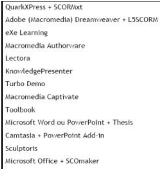
Figura 2: Ferramentas de autoria e empacotamento