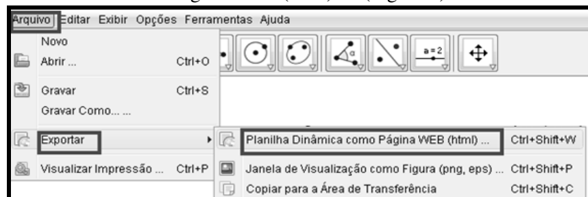
Figura 1. Passos para abertura da janela de exportação

No menu principal de uma construção do GeoGebra (arquivo.ggb), deve-se clicar em “Arquivo” e, a seguir, pausar o mouse em “Exportar”. Nas opções abertas, clica-se em “Planilha Dinâmica como Página WEB (html)...” (Figura 1).