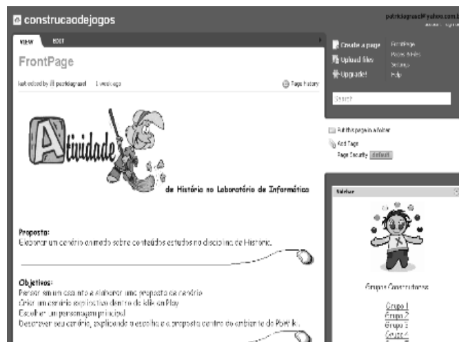
Figura 1 - Arquitetura Pedagógica no Pbworks

Como o envolvimento dos alunos com a produção dos jogos foi além dos horários estabelecidos em grupo, muitos alunos optaram por baixar o software Klik and Play em suas máquinas residências para exercitarem, tirando dúvidas, fazendo testes e resolvendo problemas. Com isso os alunos necessitaram de um ambiente que serviu de diário, e para tal contemplou-se o uso do Blog e do Pbworks (ver Figura 1 e 2) que permitiu o registro do processo pelas equipes de trabalho ou individualmente. O objetivo disso foi fomentar a aprendizagem reflexiva. Os Blogs e os Pbworks serviram como ambientes de escrita coletiva ao mesmo tempo em que os alunos organizaram suas ideias sobre o que e como iriam fazer, realizando uma auto-avaliação sobre as etapas do trabalho. Nos registros dos alunos foi possível identificar o que aprenderam e como aprenderam. O Klik and Play além de servir para a produção dos jogos, que posteriormente seriam compartilhados na web, também serviu como criação dos próprios alunos de um objeto de aprendizagem, ou seja, um jogo digital. Mas não se tratava de produzir um jogo ou qualquer jogo. Era preciso usar o Klik and Play no contexto dos conteúdos de História.