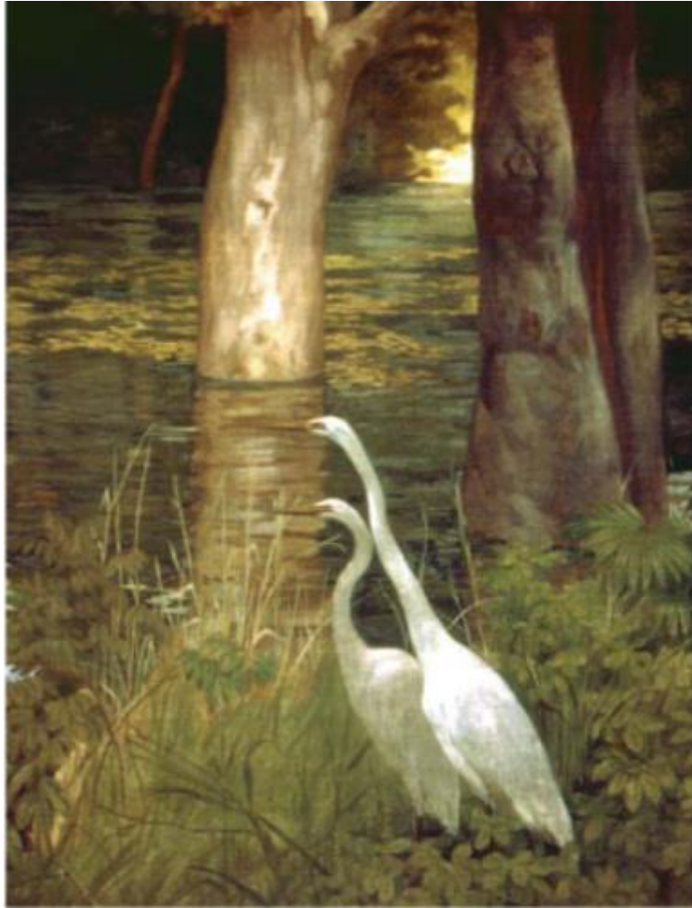
Detalhe dos painéis decorativos do Salão Nobre do Teatro Amazonas, intitulado As Garças, conforme Daou (2007).