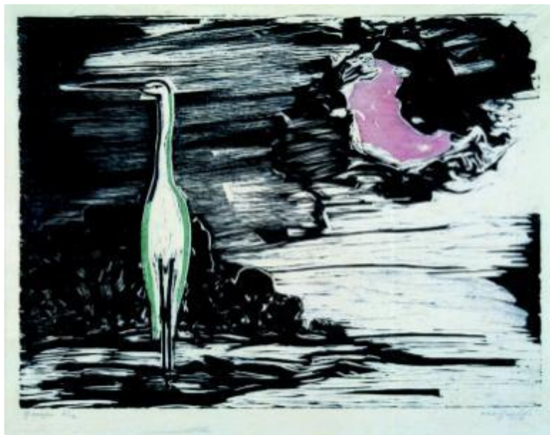
A garça – Oswaldo Goeldi, xilogravura, 1940.