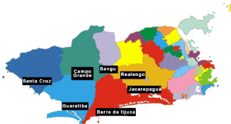
Figura 1: Mapa da Cidade do Rio de Janeiro destacando a denominada Zona Oeste.

As áreas de planejamento foram, inicialmente, conceituadas no Plano Urbanístico Básico da Cidade do Rio de Janeiro de 1976. Cada Área de Planejamento engloba algumas Regiões Administrativas, que, por sua vez, comportam alguns bairros. A zona Oeste da cidade do Rio de Janeiro compreende duas Áreas de Planejamento: a AP-4 e a AP-5. A AP-4 é composta pela Região Administrativa XVI- Jacarepaguá 7 e Região Administrativa XXIV- Barra da Tijuca 8 ; já a AP-5 pelas Regiões Administrativas XVII- Bangu 9 , XVIII- Campo Grande 10 , XIX- Santa Cruz 11 , XXVI- Guaratiba 12 e XXXIII- Realengo 13 .