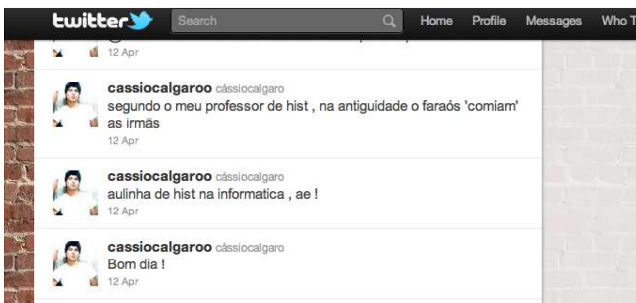
Figuras 4 e 5 □ Aluno postando no twitter a aula na sala de informática (dois dias diferentes).