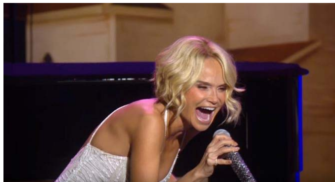
Foto 4 – Kristin Chenoweth em belting na música “Maybe This Time” de John Kander para o musical Cabaret.