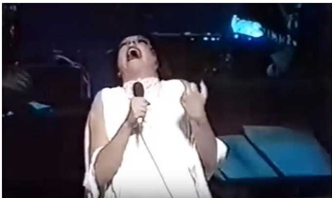
Foto 3 – Liza Minnelli em belting na música “Maybe This Time” de John Kander para o musical Cabaret.