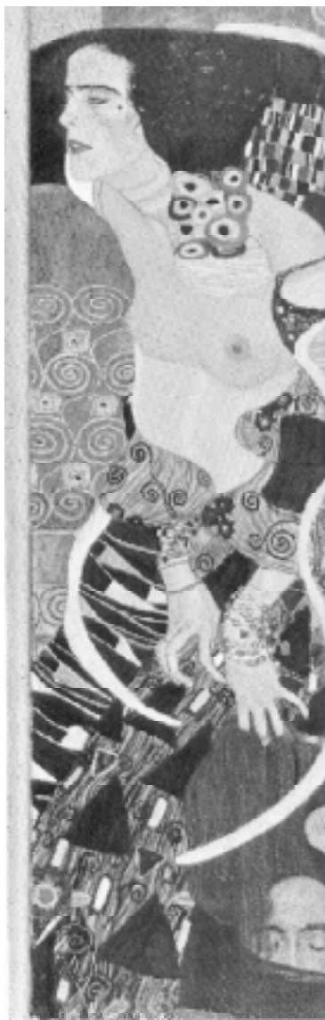
Figura 2. Gustav Klimt. Judite (II) - 1909. Galeria d'Arte Moderna, Veneza.

Como bem sabes, acabei modificando minha linha de pensamento, pois, por volta de 1939, já compreendera que não apenas a sexualidade, mas a vida enquanto tal é regida por um padrão orgiástico ao qual denominei Orgone . Se a hipótese da eletricidade apresentava-se mais fácil a uma eventual aplicação