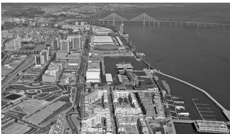
Figura 1 - Vista aérea do Parque das Nações