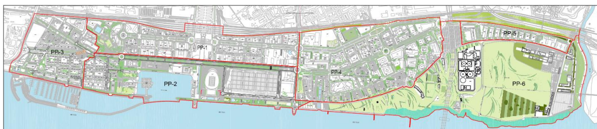
Figura 2 - Planta do Parque das Nações