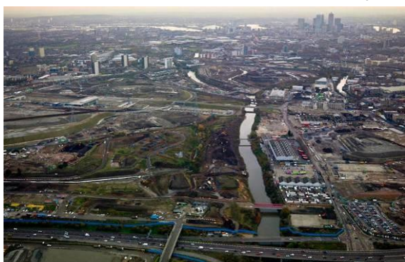
Figura 6 - Lower Lea Valley antes da regeneração e depois