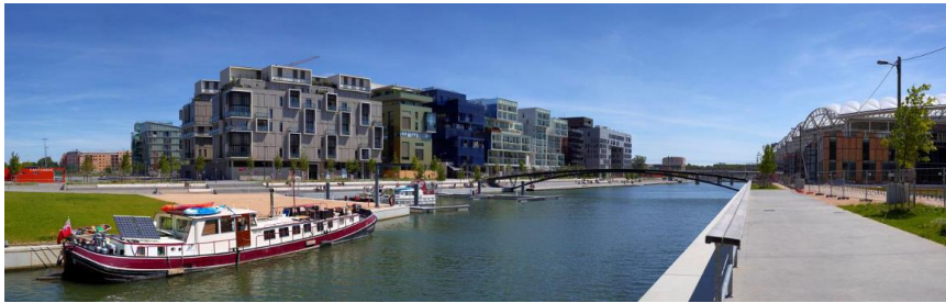
Figura 3 - Place Nautique, vitrine do projeto