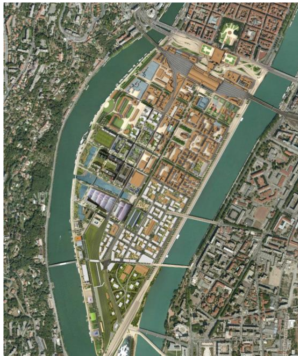
Figura 4 - Vista aérea do projeto La Confluence