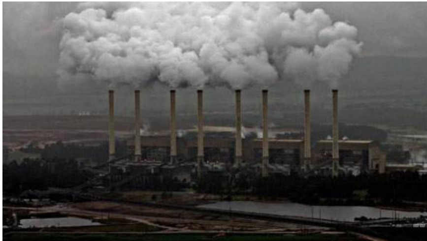
Figura 2 - Central termoelétrica a carvão em Hazelwood, Austrália

Os países participantes na Cimeira de Copenhague em 2009 reconheceram a evidência de que “o aumento da temperatura global não deveria exceder 2 °C”, isso apesar de um número cada vez maior de investigadores ser da opinião que esse valor é muito permissivo. Contudo, os mesmos países não conseguiram chegar a acordo quanto à definição de metas vinculativas e significativas de redução de emissões de carbono (DIMITROV, 2010; NEW et al. , 2011). Em vez disso, diferentes países decidiram adotar diferentes metas individuais. Os Estados Unidos aceitaram reduzir em 17% suas emissões totais de CO 2 até 2010, mas relativamente ao ano de 2005 (UNITED..., 2009). Já a China e a Índia não aceitaram uma redução de suas emissões totais, mas, antes, uma redução da intensidade de carbono (carbono/unidade de PIB) até ao ano 2020, entre 40% e 45% para a China, e entre 20% e 25% para a Índia (UNITED..., 2009). Goldenberg e Prado (2010) analisaram as referidas