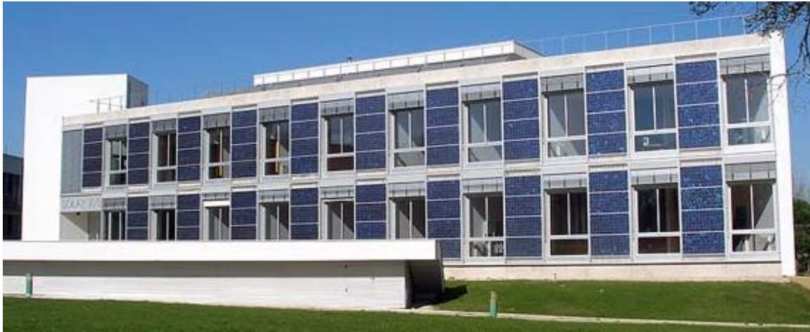
Figura 3 - Edifício Solar XXI, construído entre 2004 e 2005 (inaugurado em 2006) no campus do Ineti em Lisboa, com base no conceito “Towards net zero energy”

O termo “net” refere-se ao saldo energético entre a energia fornecida e a energia devolvida à rede durante certo período, usualmente um ano, o que significa que “Net ZEB” refere-se a edifícios com saldo zero, enquanto o conceito incluso na nova EPBD refere-se a edifícios com saldo energético negativo. Das várias novidades inclusas na nova EPBD, o conceito NZEB é aquele de mais difícil transposição por parte dos Estados-membros. O artigo 9 aponta para 31 de dezembro de 2020 como a data-limite a partir da qual todos os novos edifícios deverão respeitar o conceito NZEB (31 de dezembro de 2018 para os edifícios públicos). O artigo 2 da nova EPBD explicita esse conceito da seguinte forma (EUROPEAN..., 2010b, p. 6):