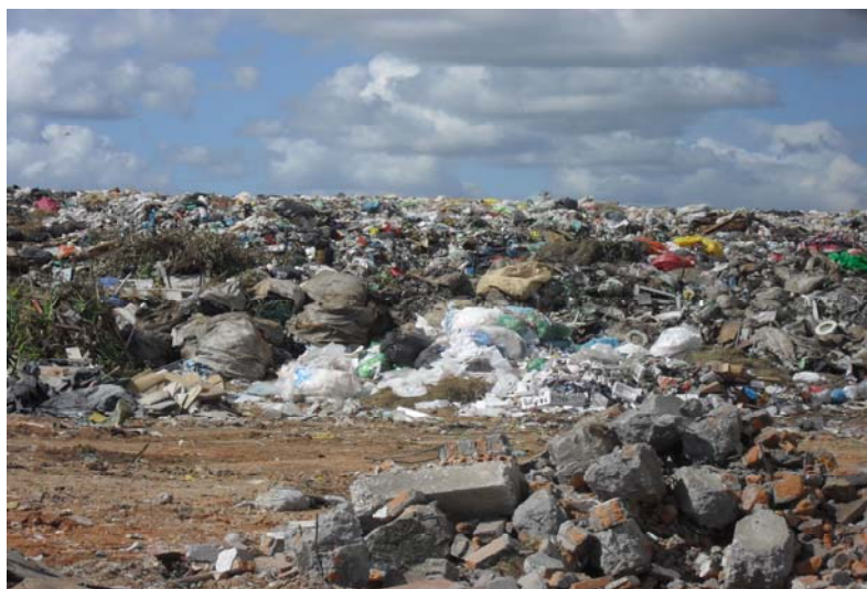
Figura 1 - Disposição de RCD e resíduos sólidos domiciliares no aterro controlado de Pelotas, RS