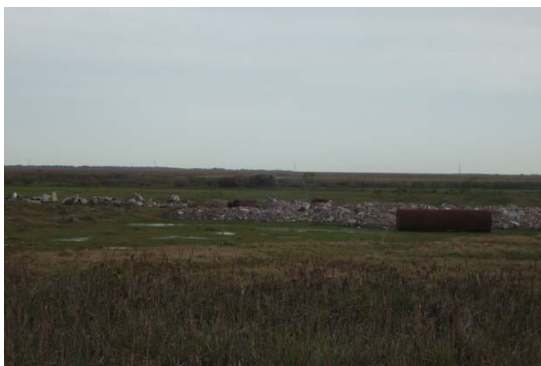
Figura 3 - RCD depositados junto aos banhados no município de Pelotas, RS

Observou-se que a deposição irregular de RCD ocorreu com maior frequência ao longo da malha viária do município e nas margens do Canal São Gonçalo. A região onde se localiza a malha viária é mais afastada do centro do município e com presença de banhados, o que gera um grande impacto ambiental, demonstrado na Figura 3.