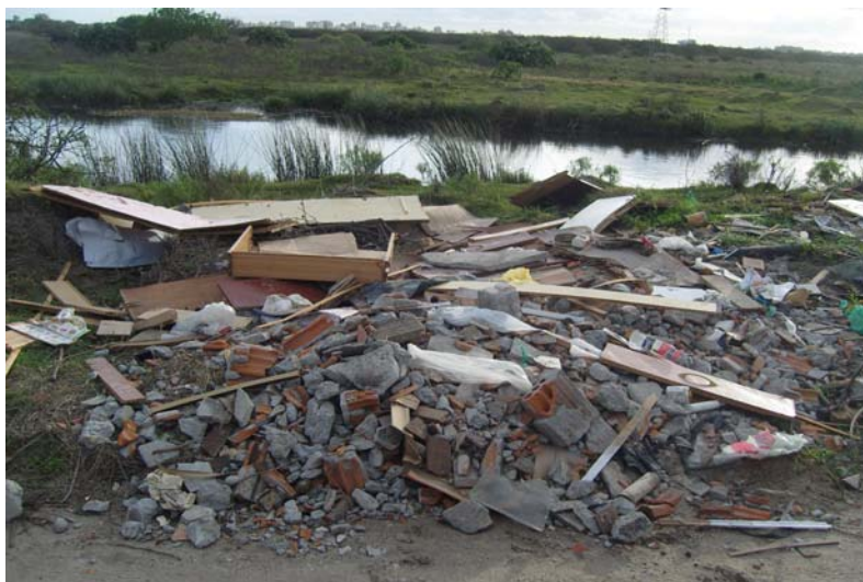
Figura 4 - RCD depositados próximo a afluentes do Canal São Gonçalo, em Pelotas, RS

Durante 2009, foram coletados, pelas empresas licenciadas e pelo serviço público de coleta, 98.305 m 3 de RCD. Assim, tem-se uma geração mensal no município de 8.192,08 m 3 ou 315,08 m 3 /dia (considerando 26 dias úteis no mês). A taxa de geração per capita é 1,23 kg/hab.dia (considerando a densidade do RCD igual a 1,28 ton/m 3 obtida na pesquisa e mencionada posteriormente).