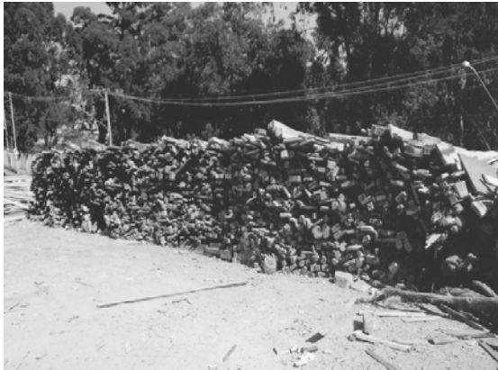
Figura 3 - Triagem de madeiras em ATT privada