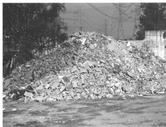
Figura 2 - Triagem da fração mineral em ATT privada

A triagem destes materiais permitiu uma redução significativa da massa de resíduos a ser disposta no aterro público; a fração mineral dos RCD passou a ser reutilizada em obras de cascalhamento e manutenção de vias (Figura 2). As madeiras passaram a ser entregues a interessados em utilizá-las como suprimento energético de olaria (Figura 3), e os plásticos, metais e outros materiais passaram a ser vendidos para empresas recicladoras. Em 2004, Gentil Ferraz avançou na recuperação dos materiais que são depositados na ATT, iniciando a operação da primeira recicladora privada de RCD da cidade de São Paulo (Figura 4).