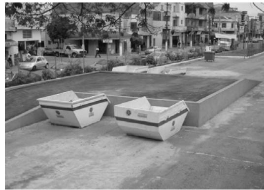
Figura 5 - Ponto de entrega voluntária de materiais inservíveis

Uma rede de áreas públicas para o recebimento gratuito de pequenos volumes de materiais inservíveis da construção civil também passou a ser implantada. Em 2003 entrou em operação, na região da Móoca, a primeira unidade (Figura 5) e até o final de 2004, as obras de quatro novas áreas públicas foram finalizadas.