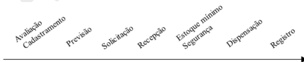
Figura 1 – Cadeia logística do gerenciamento de materiais para assistência ao usuário no domicílio em conformidade com a NT01/1

A figura 1 sumariza a cadeia logística do gerenciamento de dispensação de materiais em conformidade com a Nota Técnica nº 01/2017, em um fluxo de etapas de processos de trabalho que permite a sua replicação em outros cenários da saúde.