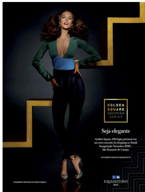
Figura 8 – Anúncio com a presença da mulher no papel “manequim”