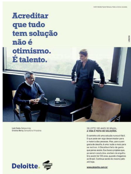
Figura 2 – Anúncio com a presença da mulher no papel “profissional”

Fonte: Revista Veja , edição de 28/9/2011 (VEJA, 2011a).