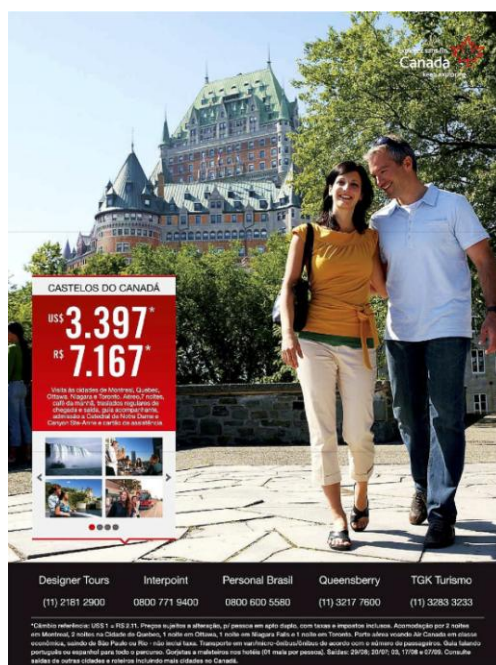
Figura 4 – Anúncio com a presença da mulher no papel “esposa”