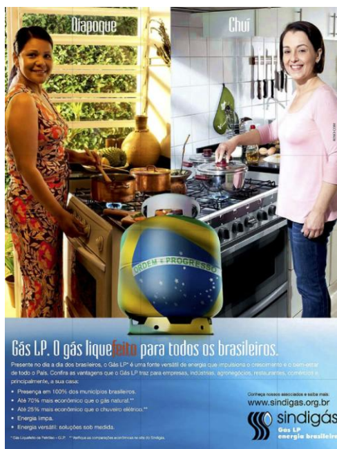
Figura 6 – Anúncio com a presença da mulher no papel “dona-de-casa”