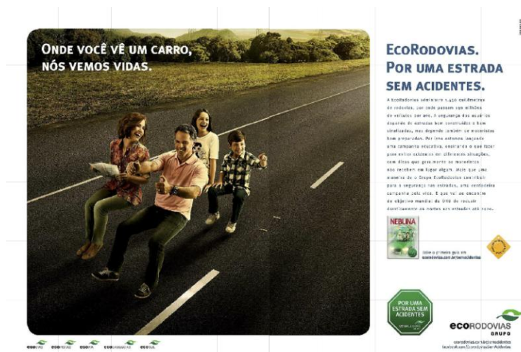
Figura 1 – Anúncio com a presença da mulher no papel “mãe”