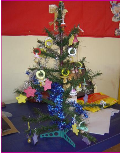
Figura 1. Recurso motivacional: árvore de chupetas criada pelos autores para estimular a remoção do hábito de sucção não-nutritiva.