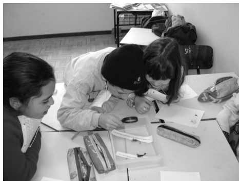
Fig.1: Escolares durante a oficina educativa.

A criança busca o prazer, fugindo sempre de coisas indesejáveis, caminhando do individual para o social. As brincadeiras deverão ser incorporadas ao currículo como um todo, sendo as questões colocadas no seu desenrolar e que possam fazer parte de pesquisas desenvolvidas em atividades dirigidas pela criança (MALUE, 2004, p. 90).