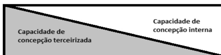
Figura 2. Espectro de envolvimento do fornecedor

Considerando este contexto, o PDP torna cada vez mais uma questão de colaboração entre a equipe interna de desenvolvimento da empresa central composto por pessoas de diferentes áreas (como marketing, design, engenharia, manufatura, qualidade, compras, etc.) e membros externos de fornecedores co-localizados ou distantes geograficamente (GASSMANN, 2003).